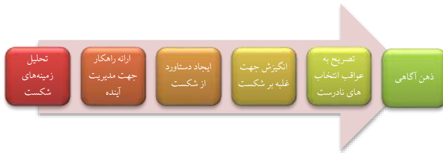
جدول ۱: کدگذاری باز و محوری داده‌های قرآنی در موضوع شفقت بر خود